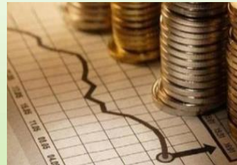
Управление государственными финансами и регулирование финансового рынка 2 238,9 тыс.рублей