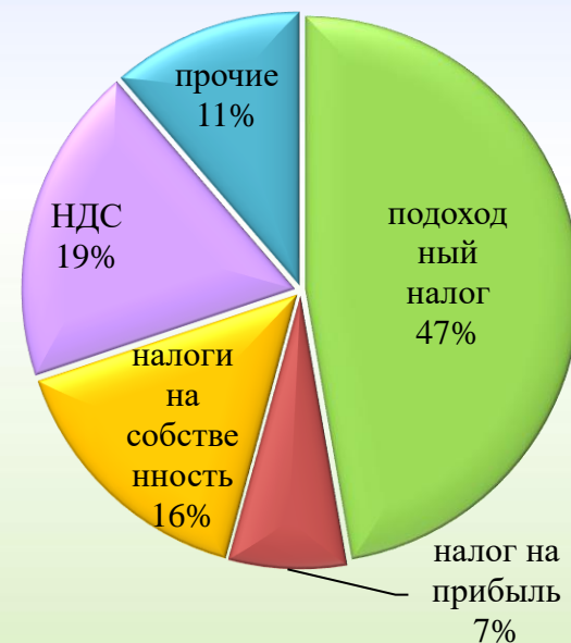
Структура доходов, %