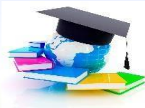
Образование и молодежная политика 27 277,7 тыс.рублей