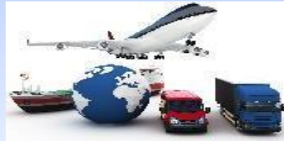
Транспортный комплекс 151,0 тыс.рублей