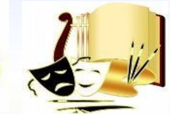
Культура Беларуси 4 253,5 тыс.рублей