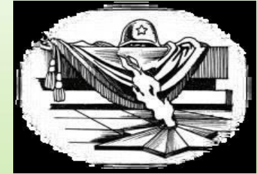
Увековечивание памяти о погибших при защите Отечества 23,5 тыс.рублей