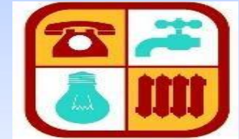
Комфортное жилье и благоприятная среда 7 143,3 тыс.рублей