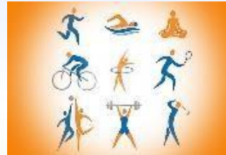
Физическая культура и спорт 1 655,8 тыс.рублей