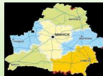
Земельно-имущественные отношения, геодезическая и картографическая деятельность 11,1 тыс.рублей