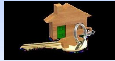
Строительство жилья 87,3 тыс.рублей