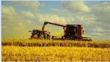
Аграрный бизнес 1 021,0 тыс.рублей