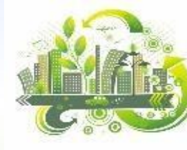
Охрана окружающей среды и использование природных ресурсов 39,5 тыс.рублей