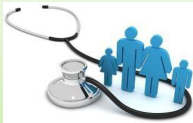
Здоровье народа и демографическая безопасность 19 878,8 тыс.рублей